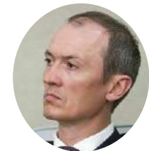
Вице-премьер РФ — руководителя аппарата Правительства Дмитрий Григоренко

Ранее из-за отсутствия финансирования школы и другие бюджетные учреждения могли «не соблюдать какие-то правила», а потом в рамках проверок надзорные государственные органы «наказывали самих себя, вынося штрафы» Это выглядело странно. Мы решили эту задачу, как обещали, у нас на сегодняшний день такие проверки запрещены, это все переведено в режим профилактики, которая запрещает штрафовать, но при этом дает рекомендации на предмет выявления нарушений и исправления, если такие есть