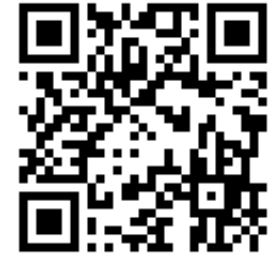
Единый календарь образовательных событий Минпросвещения России

Среди организаторов событий, размещенных в календаре, педагогические вузы Минпросвещения России, Московский государственный университет имени М.В. Ломоносова, АНО «АПГИ» и другие организации.