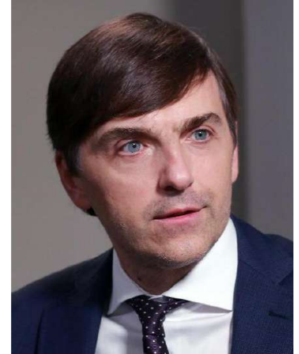
Министр просвещения РФ Сергей Кравцов